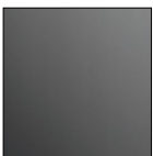
Black High Gloss