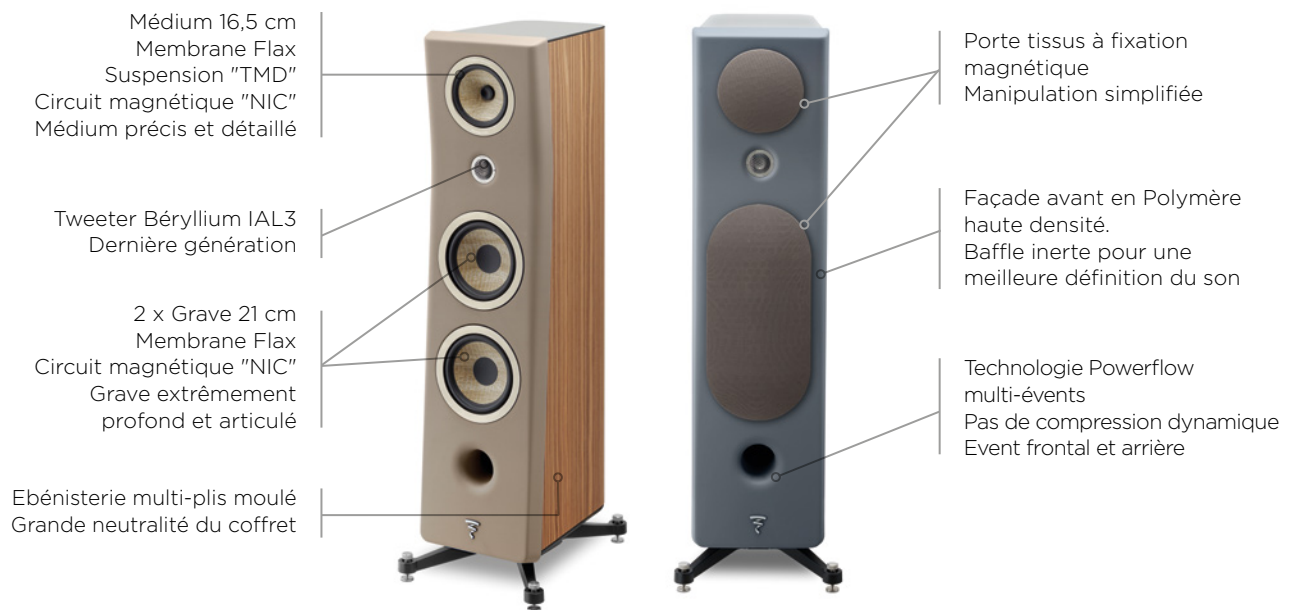
Kanta N°3, Ebénisterie Noyer, Façades Warm Taupe et Dark Grey

Kanta N°3 est la référence de la ligne. Cette enceinte 3 voies conjugue à merveille profondeur, impact et articulation du registre grave. La définition accrue et la neutralité dans le registre médium sont le résultat des innovations technologiques Flax, suspension TMD, moteur NIC. Le tweeter IAL dernière génération offre quant à lui une capacité à reproduire les plus infimes détails avec une précision chirurgicale. Cette œuvre acoustique offre un design résolument moderne et disruptif et délivrera toutes ses performances dans un salon de 40 à 80 m².